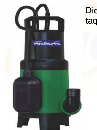
Dies sind Beispiele für tauchfähige Elektropumpen