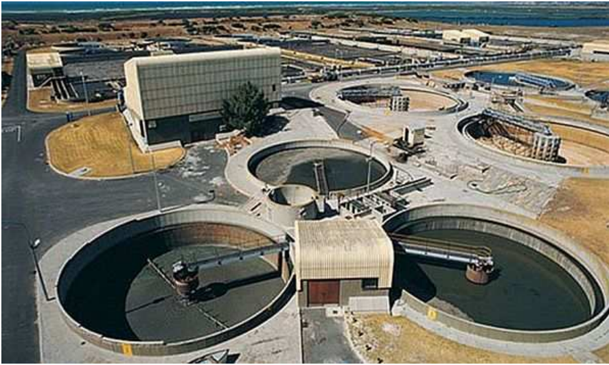
Kläranlage von Murcia

Dort ist die Gesetzgebung dazu verpflichtet ist, eine ausnahmslose Bewässerung durch gereinigtes Abwasser herbeizuführen.