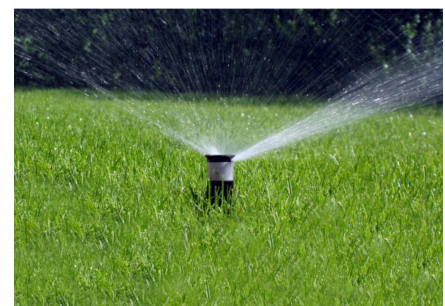
Bewässerungsanlage für den Rasen

Viele dieser Golfplätze befinden sich in Regionen mit nur wenigen Oberflächengewässern. Dementsprechend haben dort die Grundwasserreserven einen besonderen, strategischen Wert, wie z.B. in Murcia. Auf vielen Golfanlagen erfolgt die Versorgung der Bewässerungsanlagen immer noch vollkommen durch die Nutzung unterirdischer Grundwasservorkommen, während viele andere bereits auf die ebenfalls mögliche Verwendung von gereinigten Abwässern zur Bewässerung ihrer Rasenflächen umgestiegen sind. Obwohl die Verwaltung in den letzten Jahren stark auf die zuletzt genannte Technik gesetzt hat, ist sie unter den einzelnen Betreibern und Eigentümer der Golfanlagen auf nicht allzu große Begeisterung und Akzeptanz gestoßen, denn die