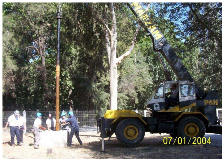
Dies ist eine Motorpumpe für tief greifende Brunnen

Letztmals trat dieser Fall dort im Sommer 2005 ein. Dies veranlasste den Wasserwirtschaftsverband des Flusses „Segura“ dazu, den Bau von 14 neuen Grabungen in den Krümmungen des Flusses „Segura“ bei dem Engpass in der Gegend „Beniaján“ zu verwirklichen. Damit versuchte man, das Ziel, dem Fluss 4 hm 3 Wasser pro Monat, aus dem Grundwasserspeicher „Vega Media“ zuzuführen. Jede Förder-stelle führt dem Fluss eine Menge von 100 bis 120 Liter Wasser pro Sekunde zu. Es handelte sich zwar nur um eine vorläufige Maßnahme, jedoch blieb diese Maßname dauerhaft erhalten, da man auch in Zukunft Wasser-mangel prognostizierte.