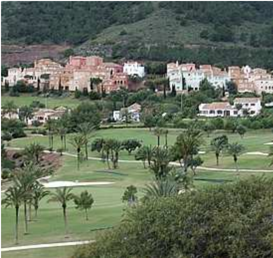
Golfplatz in der Region Murcia La Manga Club

Eine der neuartigsten Nutzungsformen der Gewässer im Mittelmeerraum ist die Versorgung von Golfplätzen. In Spanien tauchen diese Sportgelände mit zunehmender Anzahl auf.