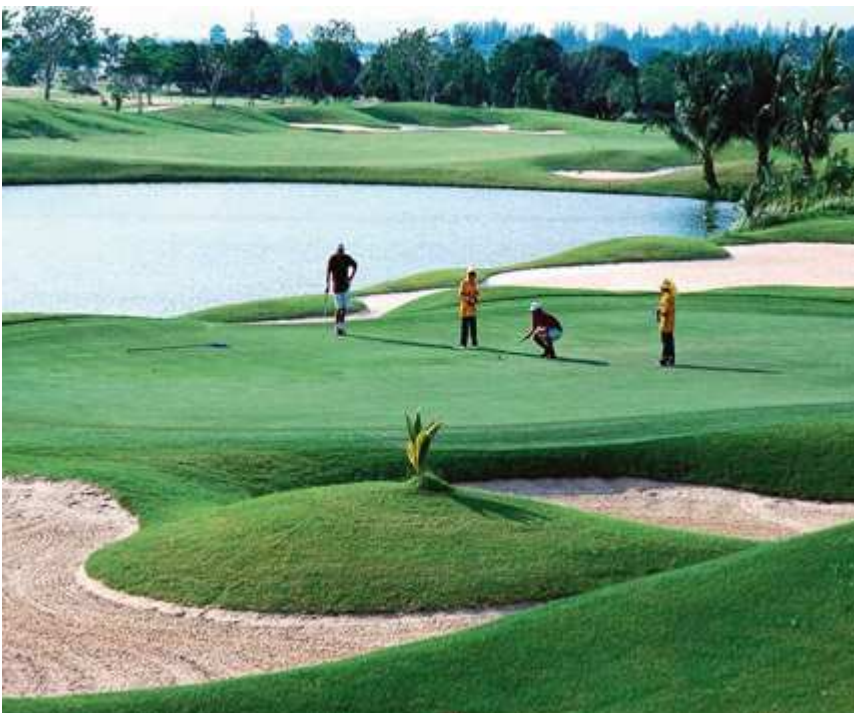
Golfanlage mit kleinem See

Die Herabsetzung der Wassermengen mit hoher Qualität für die